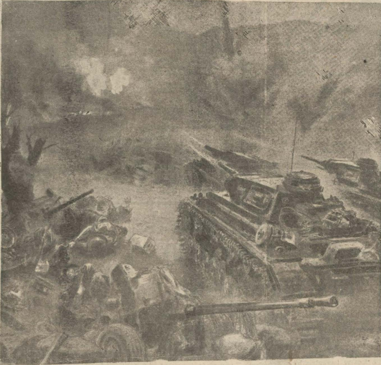
Korkunç bir muharebe sahnesi: Tankların ilerleyişi

Yunanistan mukavemet kuvvetinin son ra'se'leriyle istilayı durdurmaya çalışırken bu memleket için Amerikadan olarak silah ve mühimmat ile dolu 21 vapurdan mürrekkeb kâfile bu defa buğday ile yüklü olarak çoktan Pire - limanında bulunmakta.